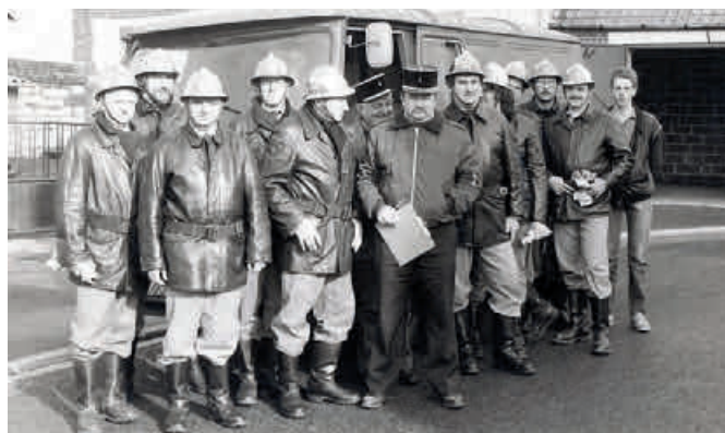
Les pompiers devant leur local avec leur camion vers 1980

On voit également l'évolution des techniques et des moyens accordés aux pompiers. D'un simple bénévolat au XIX e siècle, le corps des pompiers se professionnalise au XX e siècle avec l'apparition de nouvelles technologies. Une pompe est acquise dès 1868 à Dainville avec le soutien de la Mairie. Par la suite un camion et un local situé près de l'église seront attribués au corps des pompiers.