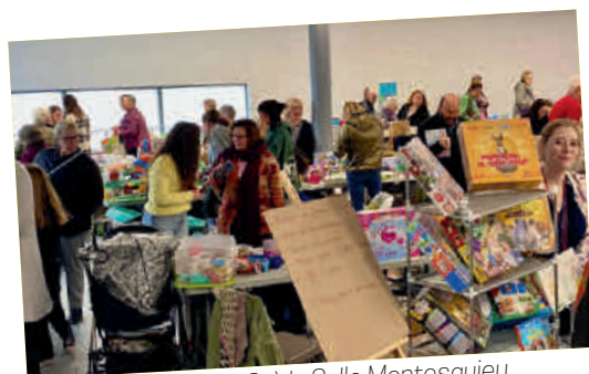
BOURSE AUX JOUETS à la Salle Montesquieu organisée par les AS du jeu