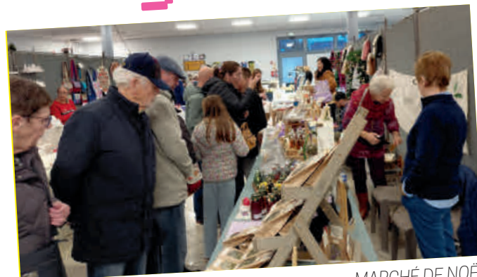
MARCHÉ DE NOËL organisé par Dainville Loisirs et Fêtes