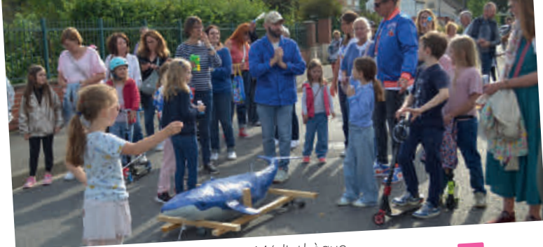
EXPOSITION "infiniment bleue" à la Médiathèque