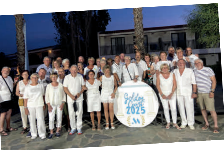
VOYAGE DES AÎNÉS en Grèce !