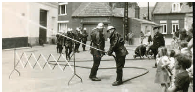
Le caporal Lucien Planchon