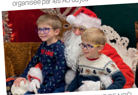
ILLUMINATIONS DE NOËL au Pôle Enfance Jeunesse