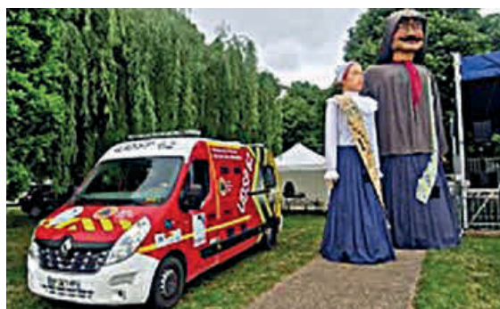
Article rédigé par Pierre Créteur et le club d'histoire locale de Dainville

À travers les décennies, les pompiers de Dainville ont su évoluer sans jamais perdre leur âme. Ils incarnent une tradition vivante, faite de courage, de fraternité et de service. Leur histoire, riche de lettres, de photographies et de souvenirs, mérite d'être racontée, partagée et célébrée. Car à Dainville, être pompier, c'est bien plus qu'un métier : c'est une vocation, une mémoire, une fierté.