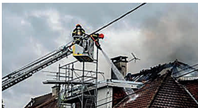
Une toiture en feu à Dainville

Aujourd'hui, les pompiers de Dainville sont intégrés au Service Départemental d'Incendie et de Secours (SDIS) du Pas-de-Calais. Ce rattachement garantit une formation continue, un équipement moderne et une coordination efficace avec les autres centres du département. Mais l'esprit local demeure, celui d'un engagement volontaire, d'une passion transmise, d'un lien fort entre la caserne et la commune. De nombreux Dainvillois sont encore pompiers volontaires et sont présents lors des manifestations municipales.