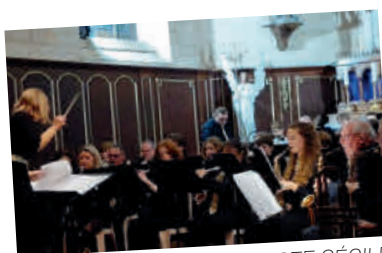
LYRE : CONCERT DE LA STE CECILE et Remise des diplômes pour les enfants de l'école de musique