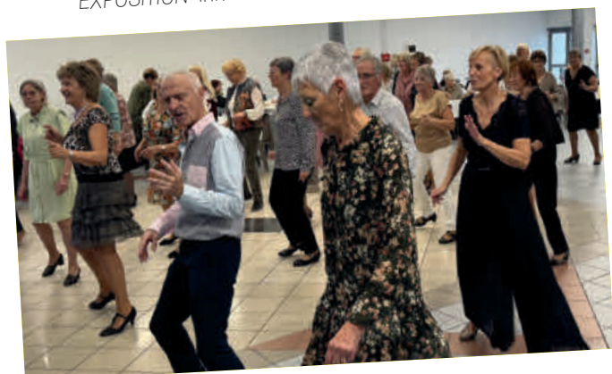
THÉ DANSANT du Foyer de l'amitié