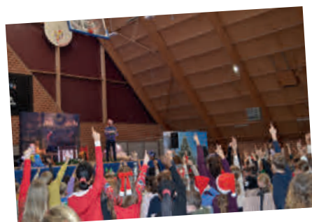
SPECTACLE DE NOËL des écoles