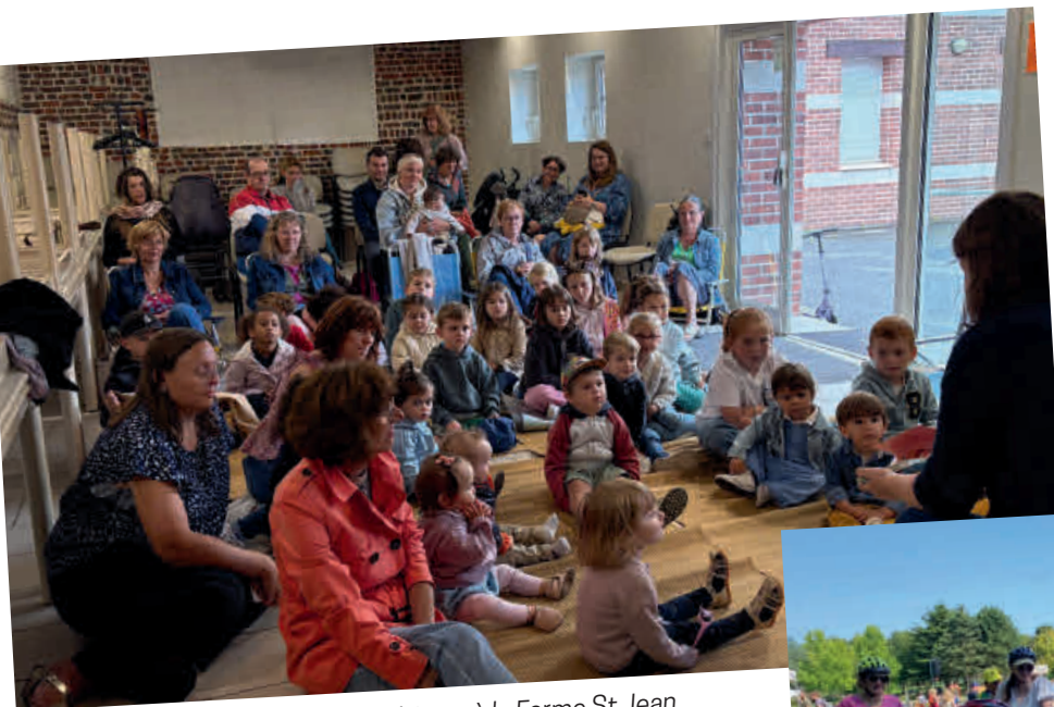
PARTIR EN LIVRE avec la Médiathèque à la Ferme St Jean