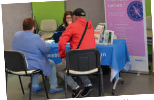
PORTES OUVERTES France Services