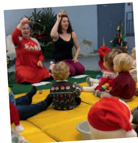
ARBRE DE NOËL du Relais Petite Enfance